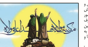
مهرنگار حضرت علی

خداوند در سوره مائده، آیه ۶۷ می‌فرماید: «فما یفلت رسالتهم...» اگر ایضاً آنچه از حدت برآورد نازل شد به خلق برسان که اگر نرسای علی علیه رسالت و الهه وظیفه نکرده ای...» بسیاری از علمای اهل سنت، شان نزول این آیه را، چنانچه حضرت علی علیه السلام و نصب آن حضرت از سوی رسول خدا صلی الله علیه و اله و سلم، در غدیر خم دانسته اند، که به عنوان مثال، به برخی از این منابع اشاره می‌کنیم: ۱- حاکم حسکسانی حنفی نیشابوری در کتاب «شواهدالتزئیل لافواعالتفصیل»، ج ۱، ص ۱۹۲، چاپ ۱۳۸۵ ه. ۲- آؤسی بغدادی در کتاب «روح المعانی»، ج ۴، ص ۲۲۶ چاپ بیروت. ۳- فخر رازی در «التفسیر الکبیر»، ج ۴، ص ۴۰۱ چاپ بیروت. ۴- جلال الدین سیوطی در کتاب «الدر المنثور فی التفسیر بالمأثور»، ج ۲، ص ۱۰۹ چاپ بیروت ۵- محمد عبده در تفسیر «المنار»، ج ۶، ص ۴۷۳ چاپ بیروت. ۶- پروتستانی در کتاب «الملل و النحل»، ص ۱۲۱ چاپ بیروت. ۷- فتدوی حنفی در «بتایع الموده»، ج ۱، ص ۳۵۹ چاپ اول، انتشارات اسوه، قم، ۱۴۲۲ ه. ق. منبع فوق الذکر در کتابخانه شهید مطهری مدرسه علمیه باقرالمومنه‌شهرستان گراش موجود می‌باشد. شیخ‌احمدپریزگار