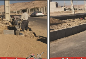
رواق پروژه های تازه با حضور شهردار جدید گراش