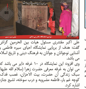
سومین نمایشگاه مادر بی نشان

گراش انقلابی: سومین نمایشگاه تجسمی مادر بی‌نشان هم‌زمان با ایام فاطمیه (سلام الله علیها) در مسجد امام رضا (ع) گراش برپا شد.