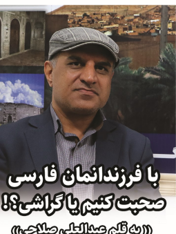
با فرزندانمان فارسی صحبت کنیم یا گراشی؟

خود را ناگزیر از پذیرفتن بدون قید و شرط همه امور می‌بینند. غافل از اینکه استعجاله بخشی از این امور که مربوط به فرهنگ و زبان می‌باشد عملاً به از دست رفتن هویت تاریخی هر ملتی خواهد انجامید. لذا در مقیاس کوچک‌تر لهجه‌های محلی ما نیز دچار چنین آفتی گردیده است با این تفاوت که فشارهای وارده از سوی قدرتهای بزرگ جهانی به جهان سوم، در مورد زبان فارسی و لهجه‌های محلی وجود ندارد و بیشترین مزایا از خود ما به ریشه‌ی گرایش محلی وارد می‌کنیم برای مثال من به‌عنوان یکی از اعضای گردآورندهی فرهنگ لغت گراشی این آمار تقریبی را عرض می‌کنم که از تعداد حدود ده هزار واژه‌ی گراشی جمع‌آوری شده که بیست سال پیش از آن استفاده می‌شده است بیش از سی درصد آن را جوانان ما در محافل روزمره به کار نمی‌برند و مطمئناً تا ده سال آینده این آمار به پنج‌ده درصد نیز خواهد رسید که روند غیر قابل برگشت می‌باشد و باید به‌عنوان هشدار پی‌پذیریم. در اینجا به دلایلی که بعضی از والدین برای صحبت کردن با خردسالان به زبان فارسی قلمه می‌کنند اشاره می‌نمایم: ۱- صحبت کردن بهتر کودکانمان به زبان فارسی. ۲- مواجعت صریح‌تر با مسائل روزمره که به‌نحو بی زبان فارسی نیاز دارد از جمله در مدارس و هنگام مراجعه به ادارات و جاهایی که باید به زبان فارسی صحبت شود. ۳- جلوگیری از مشکلاتی که خود ما پدر و مادرها در این رابطه داشته‌ایم. دربرای مورد اول باید عرض شود هدف مورد نظر هیچ‌گاه تحقق نمی‌یابد زیرا پدر و مادرها خود به فارسی سلیس و روان مسلط نیستند و گاه ترجمه‌ای لغت به لغت جمله‌ها در گویش محلی را به‌عنوان زبان فارسی به کودکان می-