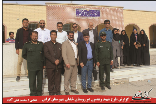
گزارش طرح شهید رهنمون در روسای خلیلی شهرستان گراش