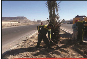
رواق پروژه های تازه با حضور شهردار جدید گراش

اصلاح پیچ انتهایی بلوار امام حسین (ع) و اتصال به بلوار شهید شیخی