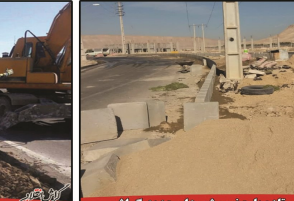
رواق پروژه های تازه با حضور شهردار جدید گراش