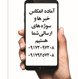
آماده انعکاس خبر ها و سوژه های ارسال شما

شهرداری به فکر ایجاد یک مانع و حفاظ دروپرو رودخانه کنار کودکانی است اصغر بلوار شهدا باشه