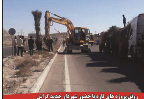
رواق پروژه های تازه با حضور شهردار جدید گراش