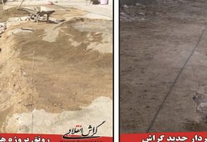
رواق پروژه های تازه با حضور شهردار جدید گراش