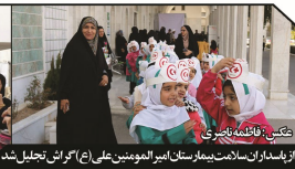
از یاسدوران سلامت هیئت مدیران امیرالمومنین علی (ع) گرایش تحلیل شده

احساس حقارت نمی‌کنند و دلیلی برای تمیز آن نمی‌بینند. در اینجا این سؤال پیش می‌آید چرا ما باید نایل به هدفی که خود به‌خود به‌صورت بهتر اتفاق خواهد افتاد، دست به کاری بزنیم که علاوه بر محو تدریجی زبان محلی که حفظ آن می‌تواند تلاطم هویت تاریخی‌مان را به‌دنیال داشته باشد یا دوگانگی فرهنگی مواجه گردیم و اصالت خود را به دست فراموشی بسپاریم.