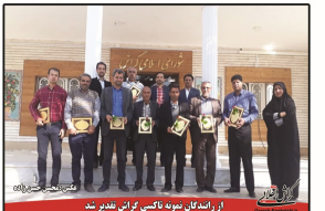
از رانندگان نمونه تاکسی گراش تقدیر شد