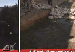
رواق پروژه های تازه با حضور شهردار جدید گراش